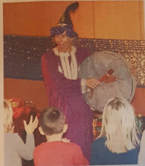
Dem Menschenfreund, auf dem Foto beim Drachentheater, haben es insbesondere die Kinder angetan.

Mit, wie er fest stellt, „ganzem Herzblut“ wirkt er am Aufbau des sogenannten Visiana-Projekts mit. Er will dazu beitragen, in unserer Gesellschaft ein neues Wir-